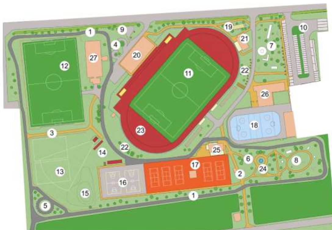
Sportovní park s areálem Svitavský stadion