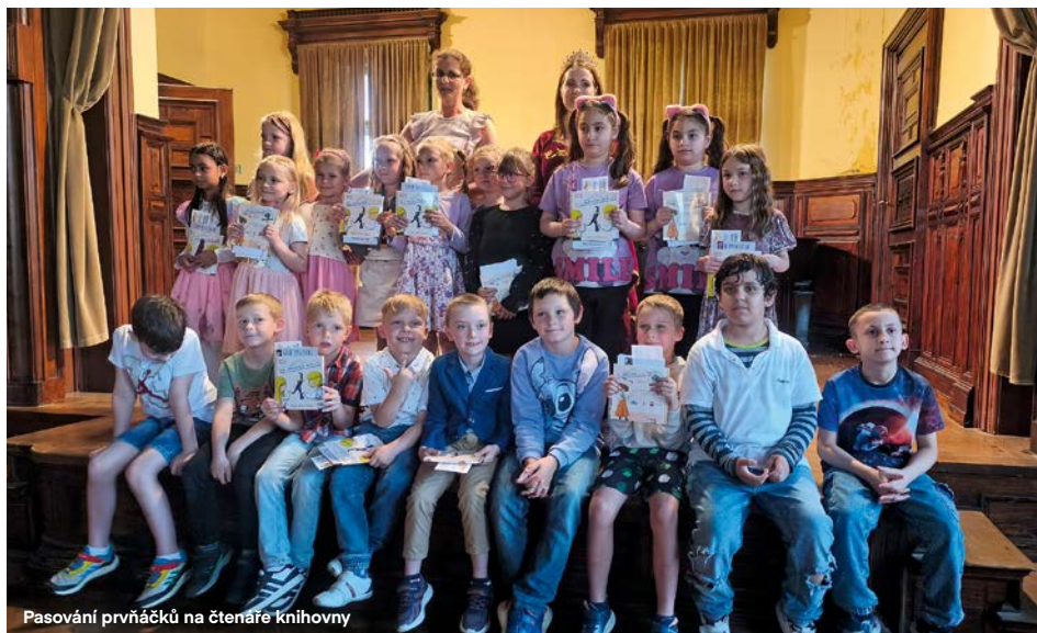
Pasování prvňáčků na čtenáře Knihovny

Přijďte si společně zahrát svou oblíbenou stolní hru s dobrovolnicemi z gymnázia.