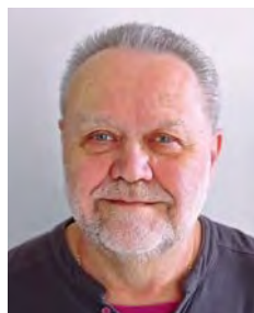
Zdeněk Petržela ZŠ a MŠ v Lačnově