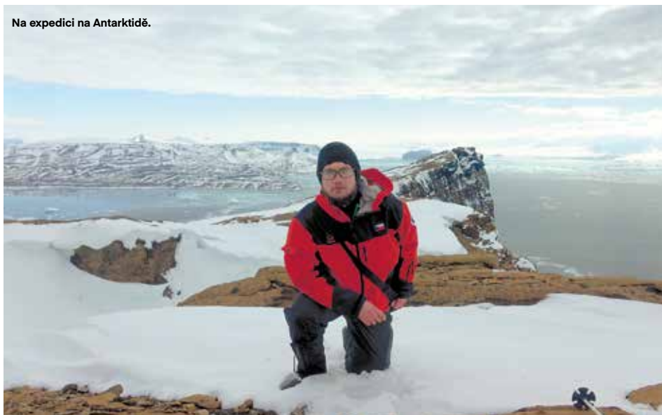
Na expedici na Antarktídě.

v Antarktídě stačí v letní sezóně podobné oblečení, jaké se používá třeba v zimě v horách. Samozřejmě musí být kvalitní. Levné a nefunkční materiály by se vám v terénu rychle vymstily. Jako spodní vrstva se hodí merino, na to mikina a na ni expediční membránová bunda. Při stoupání do kopce se dá jít i ve dvou, případně i v jedné vrstvě, když je tepleji. Ale nahore je potřeba se zase přobléct.“