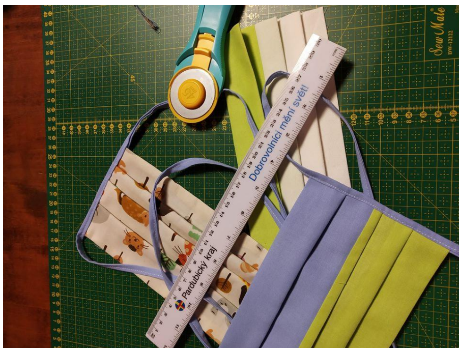
Dobrovolníci šijí roušky: