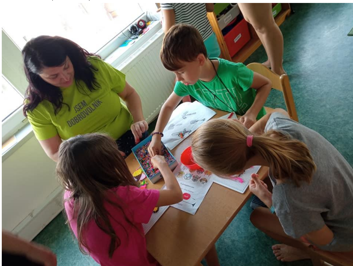
Dobrovolníci na příměstských táborech: