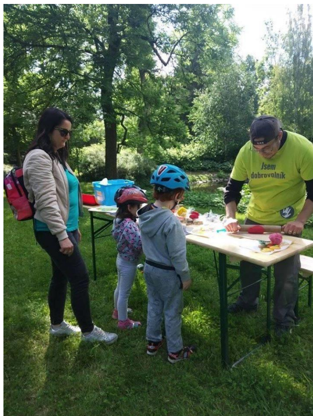
Dobrovolníci na akci pro veřejnost: Krůčkovské uteklo